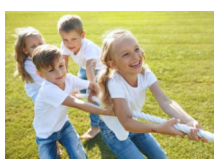
jeux squid game

- Le règlement (30€/enfant/an) : 1 à 3 chèques à l'ordre de « AJA EMS », espèces. Pour les coupons sport, chèques vacances, aide au temps libre CAF ou Pass'sport : différence non remboursée; facture possible sur demande => Nombre de places limitées. Si votre enfant est absent 3 fois sans justification sa place sera perdue .